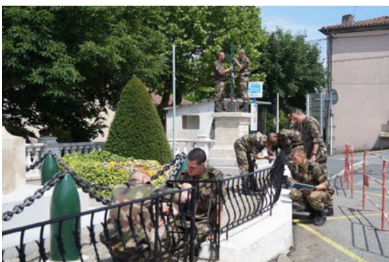
Grand nettoyage et coup de neuf au monument aux morts par une section du 8 ème RPIMa.