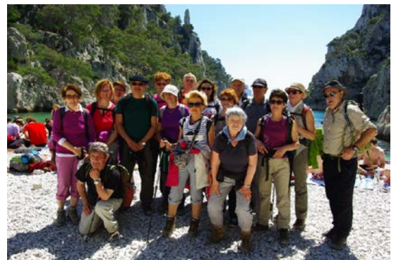
Randoval dans les calanques de Marseille