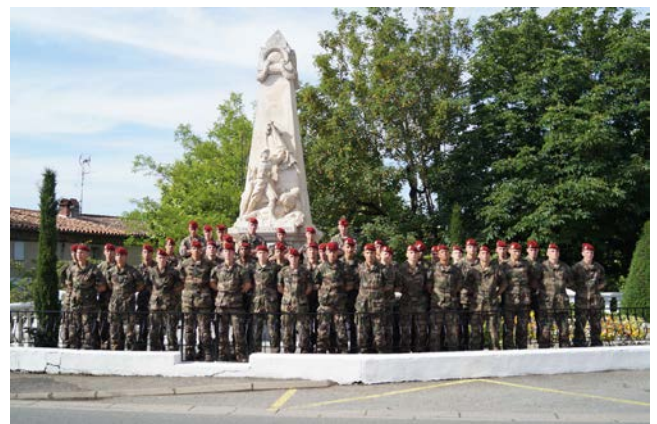
Toute la section au complet