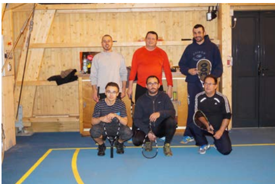
Une équipe du speedminton pendant la pause