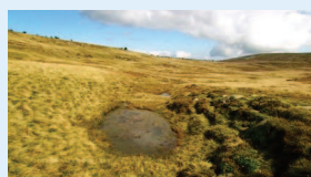
Source du Tarn au Mont Lozère